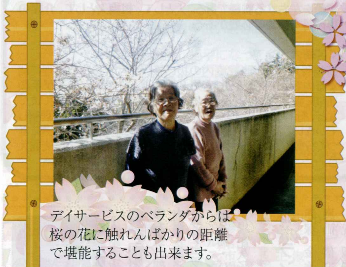
デイサービスのベランダからは桜の花に触れんばかりの距離で堪能することも出来ます。