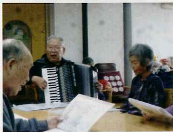
ご利用者様も、懐かしい唄を心ゆくまで楽しめました!