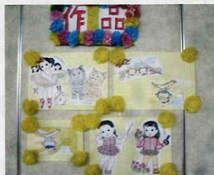
出来上がった作品は、デイのフロアに飾りました。皆様、是非見に来て下さいね!