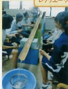
おそうめん、 おいしそうですね