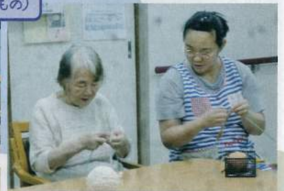
製作活動(うちわ作り)