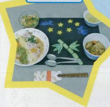
食事 今日は、七夕です。 昼食は天の河を見 立てた素麺です。色 鮮やかですね。 この日のランチョン マットや箸入れはデ イサービスお手製で す。華やかに作り、 食べるのが楽しみで すね。